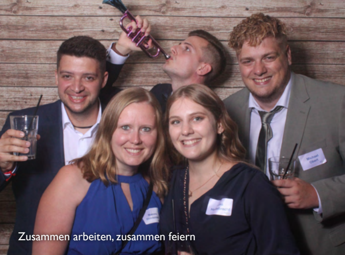
Zusammen arbeiten, zusammen feiern