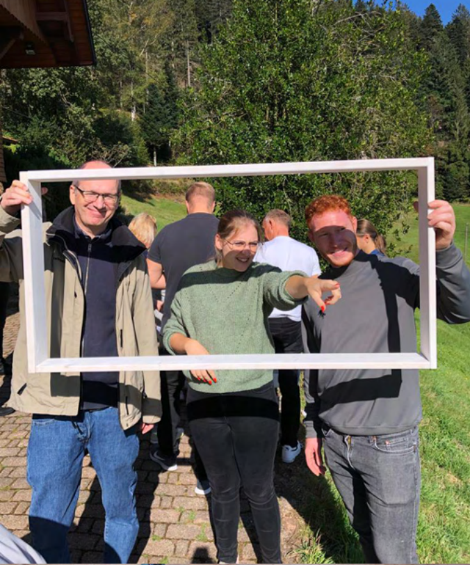
Werkeln beim Spitzmüller „Hüttenzauber“