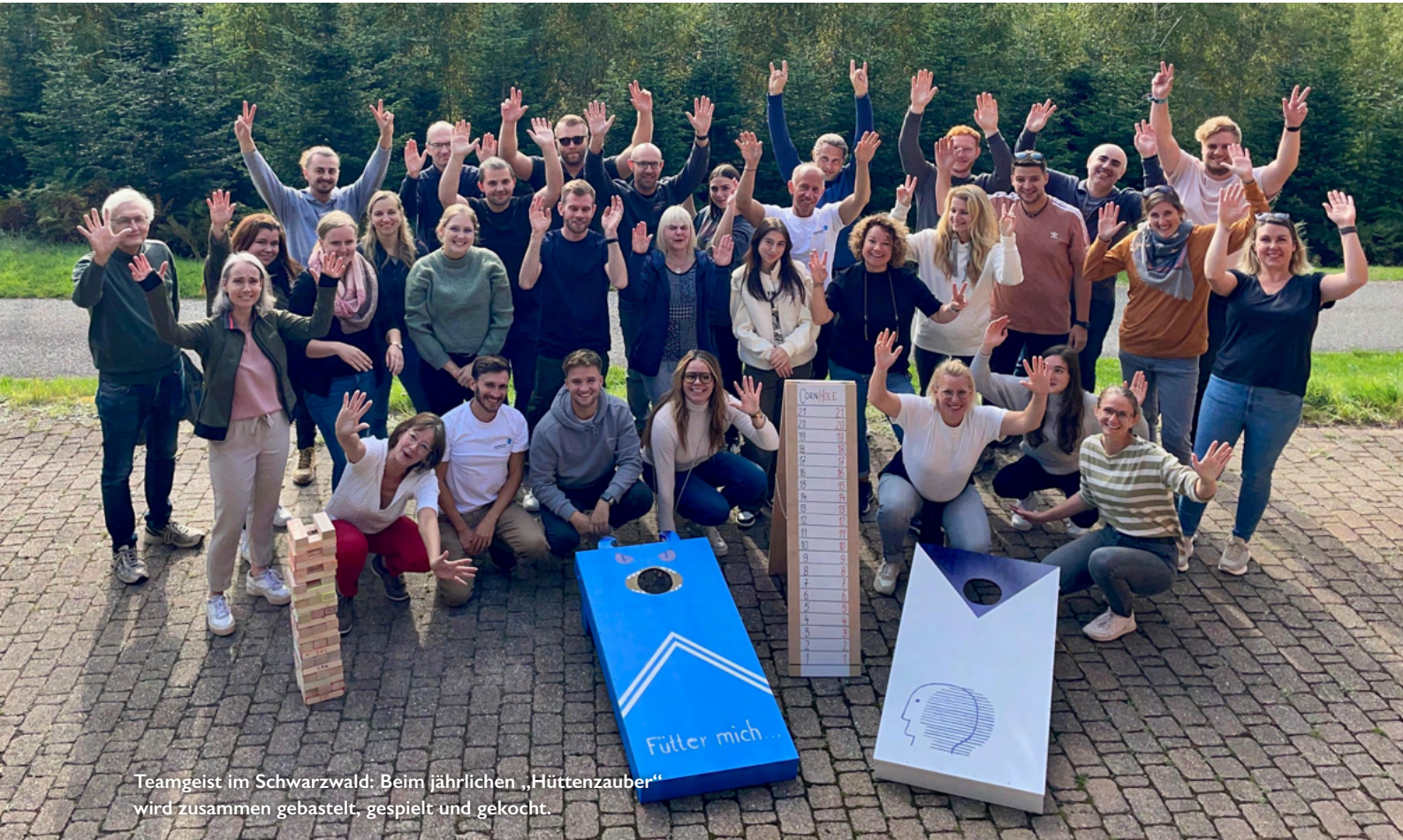
Teamegeist im Schwarzwald: Beim jährlichen „Hüttenzauber“ wird zusammen gebastelt, gespielt und gekocht.

Wir sind offiziell ein „Great Place to Work®“