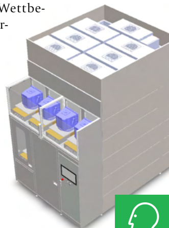
GFPS - GSEC FOUP Purification System

noch anspruchsvollere Reinheitsanforderungen erfüllen müssen. Aktuelle Reinigungssysteme stoßen hierbei an ihre Grenzen und erfordern einen hohen Aufwand, um den Anforderungen gerecht zu werden. Die GSEC GmbH hat daher ein innovatives Reinigungssystem entwickelt, das auf Patenten basiert und die zukünftigen Anforderungen nicht nur erfüllen, sondern auch übertreffen soll. Besonders innovativ ist der patentierte Ansatz zur separierten Reinigung der Behälteroberflächen. Hierdurch kann eine gezielte Reinigungsverfahren aus deionisiertem Wasser und reiner Druckluft angewendet werden. Das Resultat ist neben einem geringeren Ressourceneinsatz auf einer kleineren Anlagenfläche, ein höherer Durchsatz bei gleichzeitig hochwertigeren Reinheitsergebnissen. Das mehrfach patentierte System überbietet somit langfristig den aktuellen Stand des anspruchsvollen Wettbewerbs der Halbleiterindustrie. Gefördert wurde dieses Vorhaben mithilfe der Spitzmüller AG durch die Forschungszulage. ■