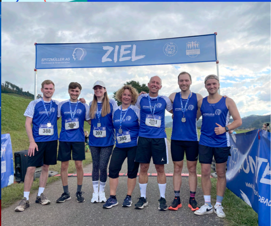
Unser Läuferteam beim Spitzmüller AG Night Run in Gengenbach.